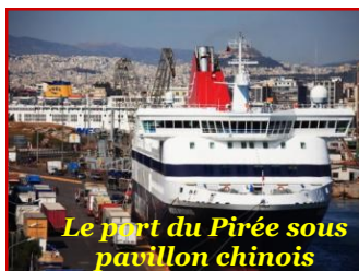
Le port du Pirée sous pavillon chinois

De plus en plus, cette expansion atteint l' Europe même. On vient d'assister au rachat par Fosun , pour 1 milliard d'euros, de 80% du n°1 lusitanien des assurances, pesant 30% du marché local. En Angleterre, à London , c'est Canary Wharf, ancien quartier industriel que Greenland , groupe chinois de génie civil, veut convertir en surface de bureaux pour 1,5 milliard d'euros. En France , on voit déjà ces châteaux du Bordelais rachetés en nombre. Surtout, Dongfeng s'apprête d'ici février à recapitaliser PSA à concurrence de 15% du capital ( et autant pour le gouvernement français ), moyennant l'invest paritaire de 3 milliards d'euros. Dans cette nouvelle tendance, on peut remarquer que les acquéreurs chinois sont de plus en plus des sociétés privées . Ces groupes