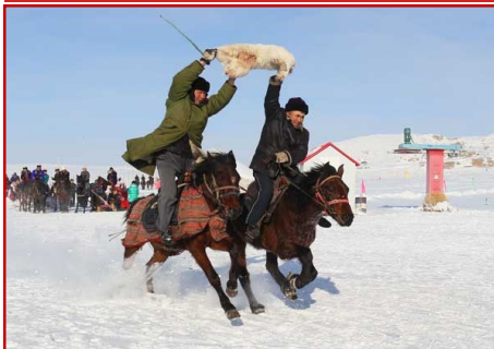
Jeux équestres d'hiver au Xinjiang