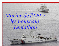
Marine de l'APL : les nouveaux Léviathan

Cela dit, les eaux sous contrôle nippon ne sont pas les seules à intéresser l'APL. Celle-ci va fixer un de ses grands garde-côtes (5000TJB) à Xishan , sa nouvelle « ville » dans les Spratley . Ceci pour mieux rayonner en mer de Chine du Sud. L'an dernier, de source officielle, elle a effectué des opérations de routine sur 18 îlots et atolls sous contrôle actuel des Philippines et du Vietnam. De quoi alimenter cette année encore entre pays voisins, tensions, jeux d'état-major et réarmement accéléré.