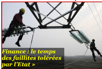
Finance : le temps des faillites tolérées par l'Etat »

Xi Jinping mène depuis son début de mandat une double campagne contre corrompus et dissidents . Elle va se durcir en 2014, au risque de mettre fin à l'« état de grâce ». Résolument optimiste, l'économiste M. Pettis voit dans ces campagnes l'outil du grand plan de Xi, dit « Rêve de Chine ». En étouffant critiques et lobbies, Xi veut accélérer la dérégulation du crédit et des taux d'intérêts , l' innovation , la réforme du droit foncier , voire la redistribution d'actifs publics aux ménages . L'idée est de réduire la croissance à 3-4% (contre 7,7% en 2013) en compensant par une hausse de productivité, de supprimer les transferts cachés offerts aux riches et aux consortia publics,