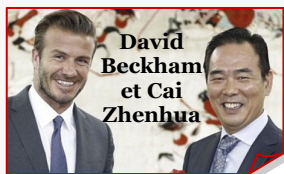
David Beckham et Cai Zhenhua

C'est hélas bien tard. Comme la Chine ne croit plus aux matchs dans ses stades, mais continue à parier, la pègre sino-hongkongaise soudoie désormais les joueurs en Italie, en Angleterre... et partout sur Terre !