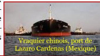
Vraquier chinois, port de Lazaro Cardenas (Mexique)