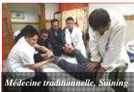
Médecine traditionnelle, Suining

On voit donc le système de santé résister à la réforme. Pourtant, la Chine vieillissante ne peut plus attendre, passée en 2009 à 178 millions de sexagénaires, avec explosion de maladies chro-