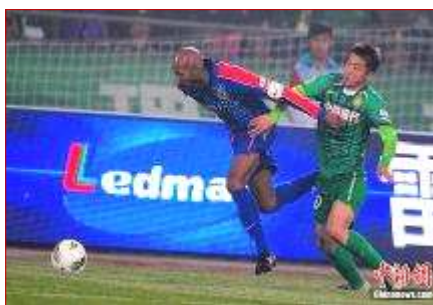
16/03, à Pékin : 1 er match pour le « Shanghaien » Nicolas Anelka, contre le Guo'an pékinois. Son but ne suffit pas à éviter la défaite à son club Shenhua 3-2.