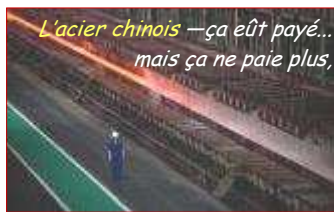
L'acier chinois — ça eût payé... mais ça ne paie plus,

« Les réformes économiques difficiles ne peuvent plus attendre », admettait le 18/03, le vice-Premier ministre Li Keqiang, futur patron (?) du Conseil d'Etat, devant Chr. Lagarde , directrice du FMI . Joignant l'acte à la parole, le 19/03, le pouvoir édictait la plus forte hausse du prix du pétrole depuis 2009, reflétant le marché mondial (+15% depuis janvier). À +6,5% voire +7%, l'essence est désormais 50% plus chère qu'en 2009 - une prime compensatoire est offerte aux paysans et taxis. Avec l'inflation retombée à 3,2% en février 2012, contre 6,5% en juillet 2011, Pékin saisit la 1 ère occasion pour relever le prix du carburant, et remettre sur ses rails le plan de réduction quinquennal d'intensité énergétique de 16% d'ici 2015. Les 3,5% visés en 2011 sont loin d'avoir été atteints, avec un résultat de 2,01%.