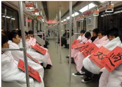
D'autres choisissent cette journée pour fêter leur liberté et indépendance ; d'autres encore, pour enterrer leur vie de garçon.

01/11, métro de Shanghai, ligne « 11 » : onze «光棍» guanggun, «branches sèches» ou célibataires voyagent, vêtus d'une couette, portant au cou une affiche rouge (propitiatoire) qui énonce leur nom et n° de tel. Pour la fête «des branches sèches», ils espèrent trouver l'âme sœur, attendre une belle voyageuse.