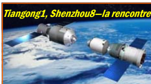
Tiangong1, Shenzhou8 –la rencontre

La Chine marche vers l'espace à l'écart des nations, par consentement mutuel, ou par tradition. Il y a d'une part les restes de souci maoïste d'indépendance stratégique. Et de l'autre, l'ambiguïté de sa démarche militaire : témoin, sa destruction par un missile d'un de ses propres satellites en 2007.