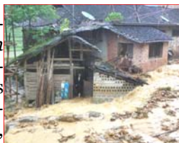
Centre : après la sécheresse, les trombes. Femme sous son auvent, se protégeant d'une coulée de boue

D'autre part le censeur socialiste est sincèrement gêné par les références au nazisme, et « en son âme et conscience », voulait épargner au peuple des scènes peu « harmonieuses »: substituer des images de sagesse confucéenne à celles d'Holocauste, n'était-ce pas là une idée chic et épatante, en plus fusionnelle du meilleur des cultures d'Orient et d'Occident? Malheureusement, aux yeux de la démocratie occidentale, le rappel des leçons de l'histoire est un devoir non négociable.