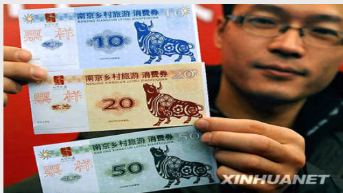
Les coupons « boeuf » de Nankin

Comment relancer le tourisme, alors que les métropoles telles Pékin voit ses hôtels désespérément déserts? La réponse du jour est le tourisme « captif » , amorcé par des coupons subventionnant jusqu'à 45% du prix d'un repas, d'un parc ou musée. Nankin (Jiangsu) débloque 20M¥. Mais s'agissant de fonds perdus, autant se faire plaisir à soi-même: 200000 foyers tirés au sort sur les 890.000 de l'agglomération, reçoivent chacun 100¥ de coupons. La ville en attend un retour décuplé, 200M¥ dans les caisses des firmes touristiques. Plus subtil, Hangzhou met le double, 40M¥ dans des bons qu'il distribue à ses ouailles, mais aussi à celles de Harbin, Changchun, Chongqing, Canton et Shenzhen, chassant ainsi le touriste sur des terres lointaines. Un autre plan de « tickets-repas » est prévu pour ses fonctionnaires. Deux autres villes suivent la même stratégie, Dongguan (Canton) , Chengdu (Sichuan) : plans grossiers, tablant sur des avantages quantitatifs. Canton innove plus, en tentant d'améliorer la qualité : il lance un plan-test de congés payés avant ou après le 1 er mai, dates laissées au libre arbitre des firmes. Ce qui permettra aux travailleurs chinois, pour la 1 ère fois, de découvrir les charmes du tourisme hors saison.