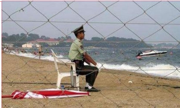
La plage des leaders à Beidaihe (Hebei), déserte après leur conclave pré-XVII. Congrès

Or à présent, Ping'An, sous la fêrue du juge, voyait cette porte se refermer. C'était un jeu à qui perd-gagne : libre enfin, à 44 ans, il larguait les amarres : hurra, hurra, la vie commençait là !