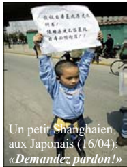
Un petit Shanghaien, aux Japonais (16/04): «Demandez pardon!»